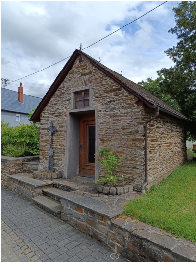
Wegkapelle in der Kirchstraße in Altstrimmig (2025)