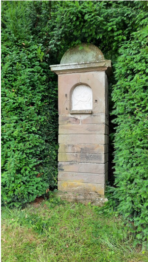
Bildstock aus Sandstein bei Schloss Ehreshoven (2024)