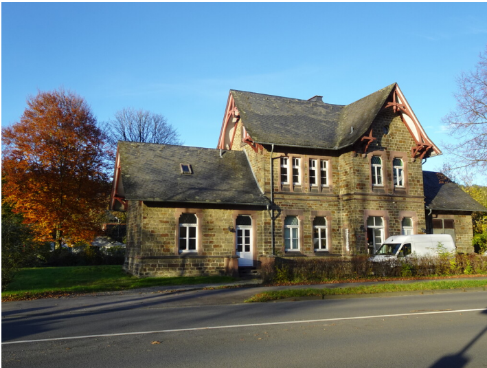
Ehemaliger Bahnhof Ehreshoven (2025).