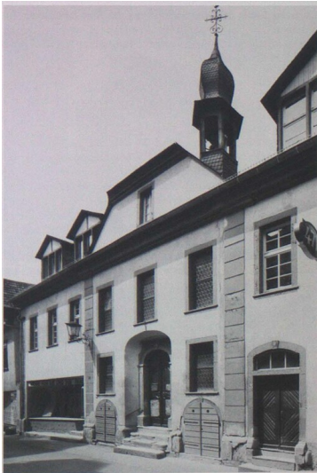
Katholische Kapelle St. Josef in Bacharach, Ansicht von Nordosten (1950er Jahre)