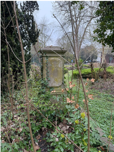
Grabstein der Töpferfamilie Heinrich Lövenich (2025)