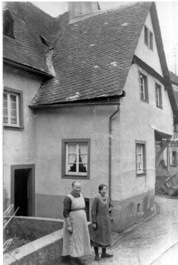
Haus Nr. 6 (vor 1930)