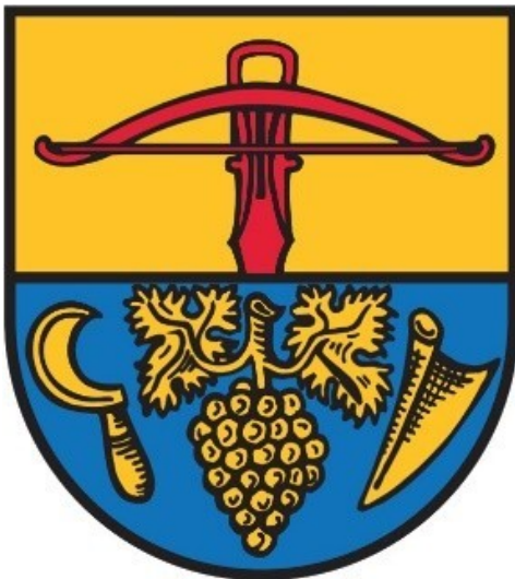
Das Wappen der Ortsgemeinde Römerberg

Bundesland: Baden-Württemberg, Rheinland-Pfalz