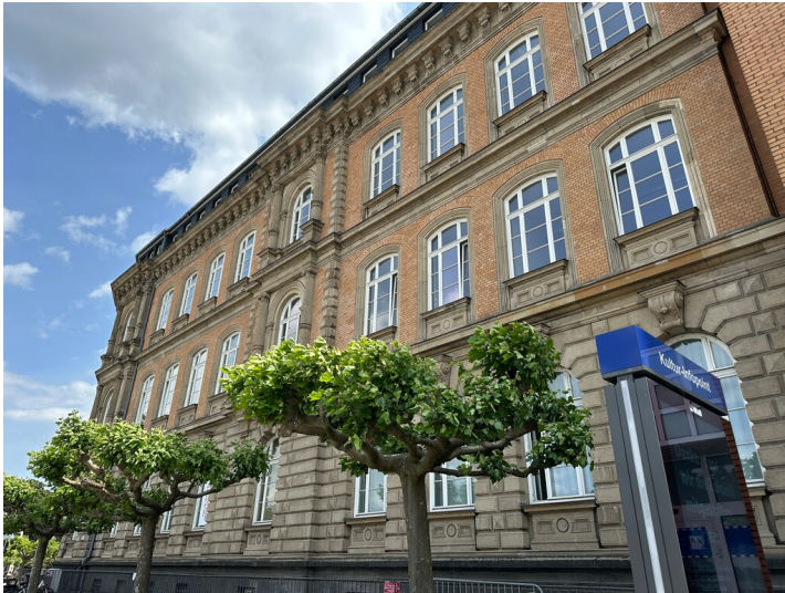
Ansicht der ehemaligen Kunstgewerbeschule in der Düsseldorfer Altstadt vom Rathausufer aus (2025). Von 1883 bis 1919 war hier die Kunstgewerbeschule angesiedelt. Heute ist das Gebäude Teil des Düsseldorfer Rathauses.