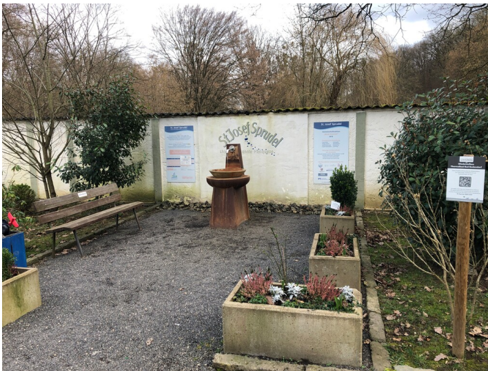
Trinkbrunnen des St.-Josef-Sprudel Bad Bodendorf (2024)