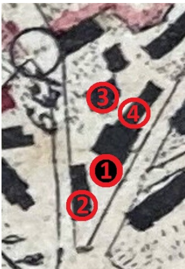
Übersicht des Gebäudebestands auf dem heutigen Grundstück Kuhberg 1 in Oberkail im Jahre 1828