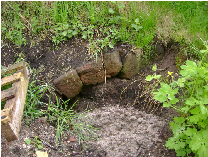
Sichtbare Reste