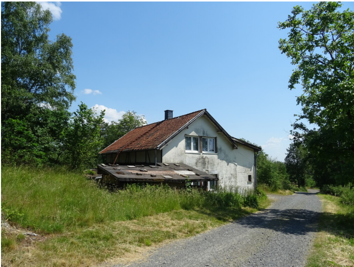
Das ehemalige Maschinenhaus des Frühlingsschachtes bei Rösrath (2023).