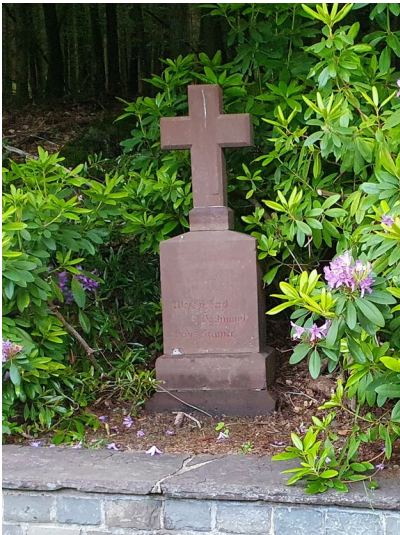
Das Gedenkkreuz zwischen Ormont und Kronenburgerhütte (nach der Bearbeitung durch den örtlichen Bauhof im April 2024).