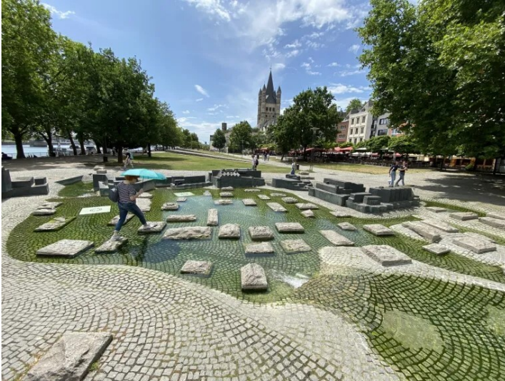
Der Paolozzibrunnen im Kölner Rheingarten (2025), Betreten ausdrücklich erwünscht!