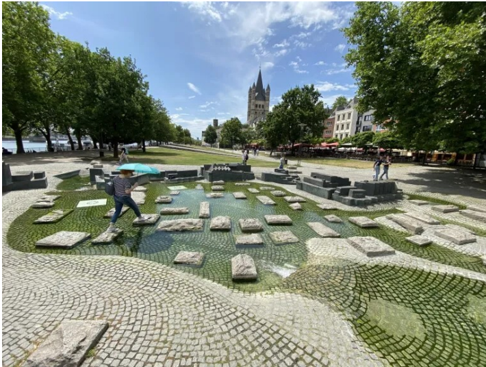
Der Paolozzibrunnen im Kölner Rheingarten (2025), Betreten ausdrücklich erwünscht!