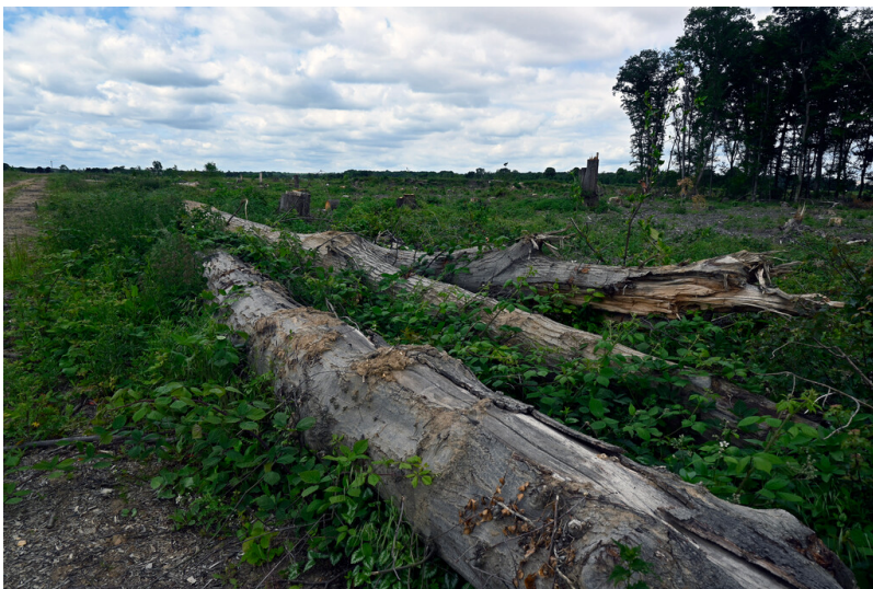
Hambacher Forst