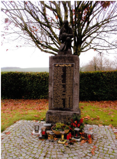
Kriegerdenkmal in Altstrimmig (2021)