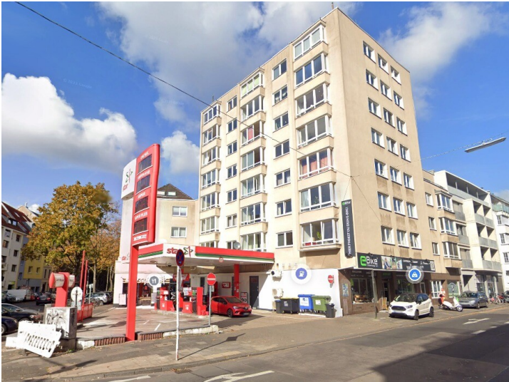
Die heutige STAR-Tankstelle Ecke Berrenrather Straße / Weyertal in Köln-Sülz, die in den 1960ern von der Familie des berühmten Rennfahrers Rolf Stommelen geführt wurde (Screenshot Google Maps, Oktober 2022).