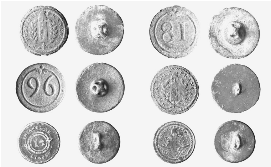
Uniformknöpfe aus Napoleonischer Zeit