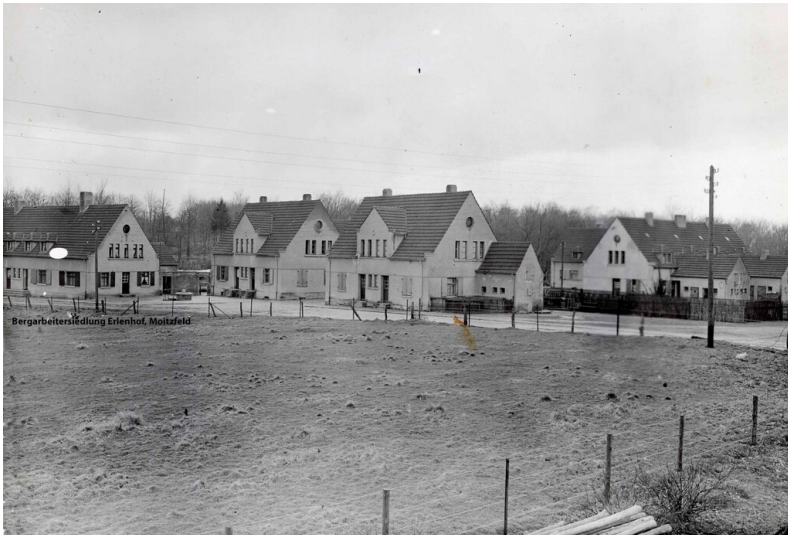
Bergarbeitersiedlung Erlenhof in Moitzfeld (um 1925).