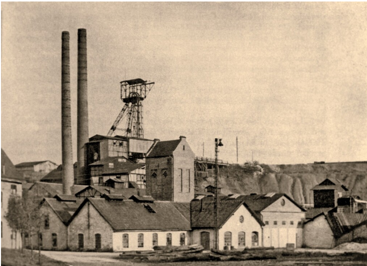
Aufbereitung und Transformatorenhaus der Grube Weiß in Moitzfeld (um 1928)