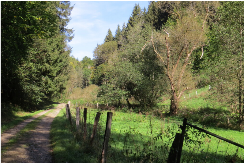
Zufahrt zur Ölmühle im Tiefenbachtal aus Richtung Rurtal (2024)