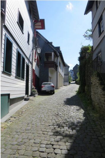
Aufgang Oberer Mühlenberg (2024)