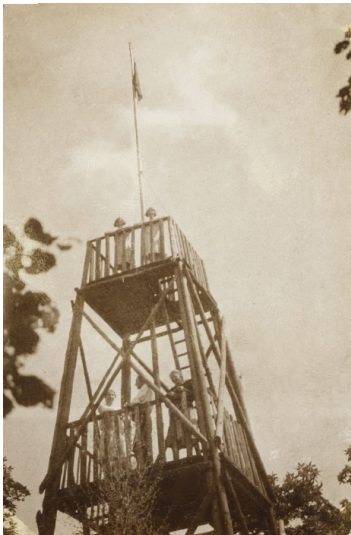
Alexanderturm in den 1930er Jahren