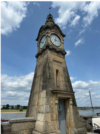
Die Pegeluhr am Rheinufer in der Düsseldorfer Altstadt (2025).