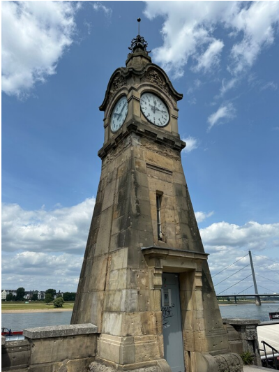
Die Pegeluhr am Rheinufer in der Düsseldorfer Altstadt (2025).