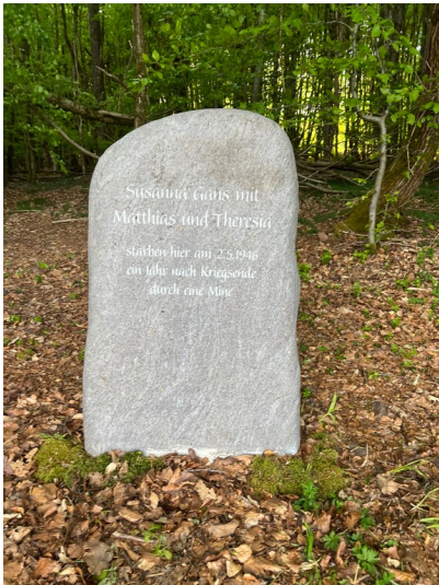
Gedenkstein in der Gemarkung Duppach (2025)