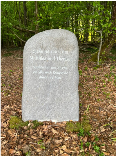
Gedenkstein in der Gemarkung Duppach (2025)