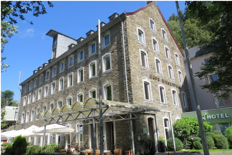
Die ehemalige Fabrik Wiesenthal (2024)