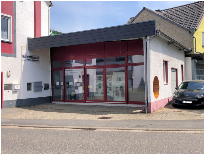
Heimatmuseum und -archiv Bad Bodendorf (2025) Fotograf/Urheber: Elmar Knieps