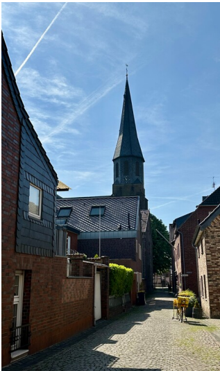
Hubertusstraße mit Kirchturm der Pfarrkirche St. Martinus in Dormagen Zons (2025).