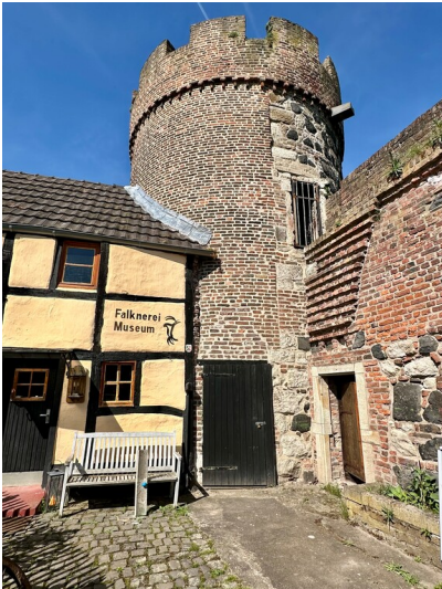
Krötschenturm mit Falknereimuseum an der nordwestlichen Ecke der Stadtmauer Zons (2025)