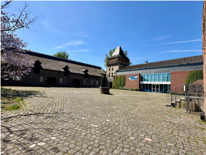
Burghof der Burg Friedestrom in Zons mit Brunnen, Wohnturm und dem Mundartarchiv (2025).