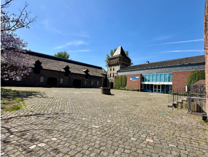
Burghof der Burg Friedestrom in Zons mit Brunnen, Wohnturm und dem Mundartarchiv (2025).