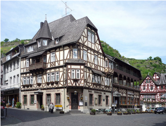
Das Fachwerkhaus Altkölnischer Hof in der Blücherstraße 2, am Markt, in Bacharach (2010)