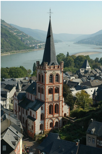
Die evangelische Kirche St. Peter in Bacharach (2005)