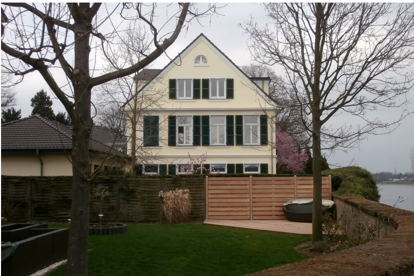
Das 1872 erbaute Herrenhaus des Dietkirchener Hofes in Wesseling-Urfeld, Ansicht der Südseite (2014).