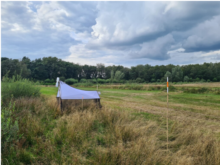
Eine Malaisefalle neben Markierstäben für Bodenfallen am Rande der Feuchtwiese in der Dingdener Heide (2024).