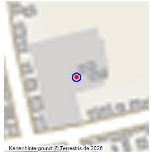
Grabplatte vom alten Kirchhof steht heute an der Friedhofshalle auf dem Friedhof von Römerberg-Mechtersheim (2024)

Auf dem Mechtersheimer Friedhof befindet sich nahe der Trauerhalle eine Grabplatte. Diese stammte ursprünglich vom früheren Mechtersheimer Friedhof und wurde bei Baumaßnahmen gefunden. Gemeinsam mit einem restaurierten Steinkreuz aus dem Jahr 1814, gefunden am katholischen Pfarrhaus von Mechtersheim, wurde die Grabplatte an ihrem heutigen Standort aufgestellt. Auf der Hinweistafel der Gemeinde Römerberg zu dieser Grabplatte lesen wir folgenden Text: