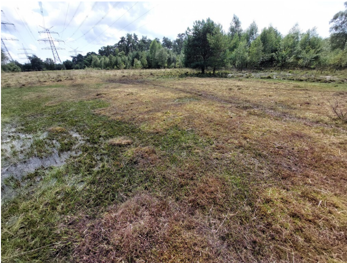
Eine Fläche in der feuchten Heidelandschaft der Aaper Vennekes mit abgefressener Vegetation (2024).