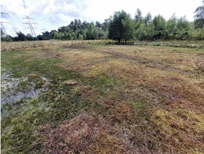
Eine Fläche in der feuchten Heidelandschaft der Aaper Vennekes mit abgefressener Vegetation (2024).