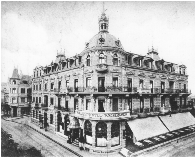
Palast Hotel in Bad Neuenahr (ca. 1910)