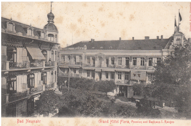
Grand Hotel Flora in Neuenahr (1905)