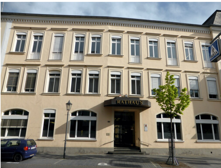
Rathaus der Stadt Bad Neuenahr-Ahrweiler (2019)