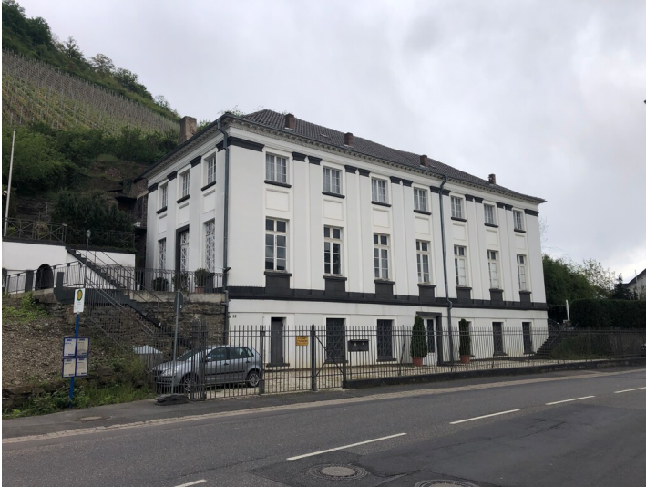
Neues Brunnenhaus in Heppingen (2024)