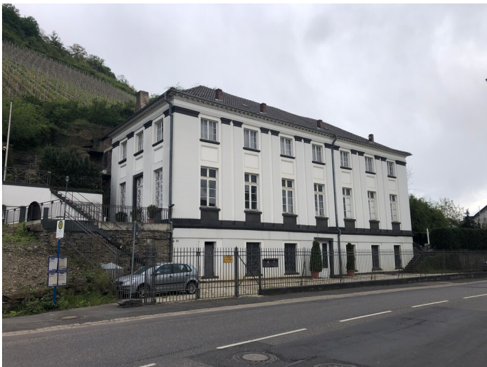
Neues Brunnenhaus in Heppingen (2024)