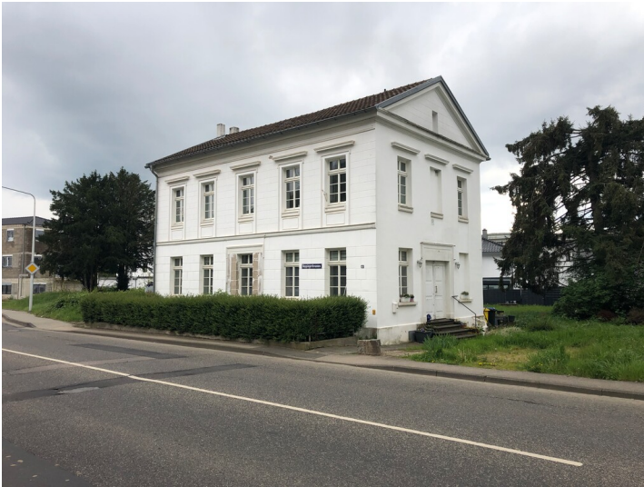
Altes Brunnenhaus in Heppingen (2024)