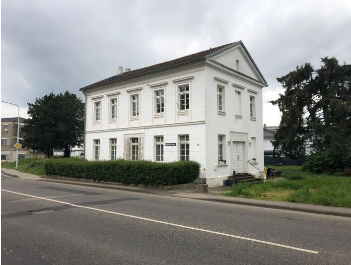
Altes Brunnenhaus in Heppingen (2024)