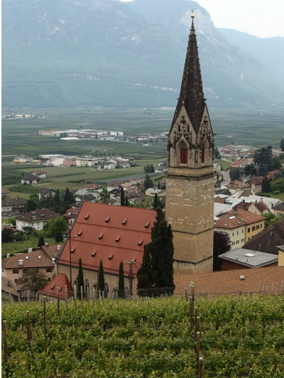
Tramin Pfarrkirche (2017)