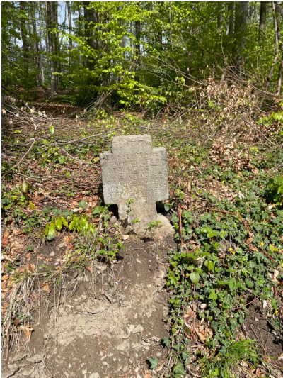
Wegkreuz Dülmener Wallfahrt - Gedenkstein für Johannes Adolfus Shmits von Bilk