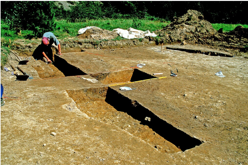
Grabung durch Gruben mit römischen Abfällen auf dem Wiesengelände der Grube Lüderich in Rösrath (2000).