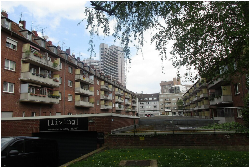
Typische Wohnsiedlung der Wolf Wohnungsbau OHG aus den 1950/60er-Jahren in der Hummelsbergstraße in Köln-Sülz (2025). Im Bildhintergrund das Uni-Center Köln.