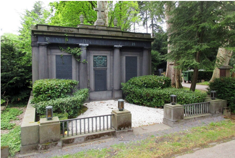
Die Grabstätte der Familie Jansen - Wolf - Dahmen auf dem Kölner Friedhof Melaten (2025).